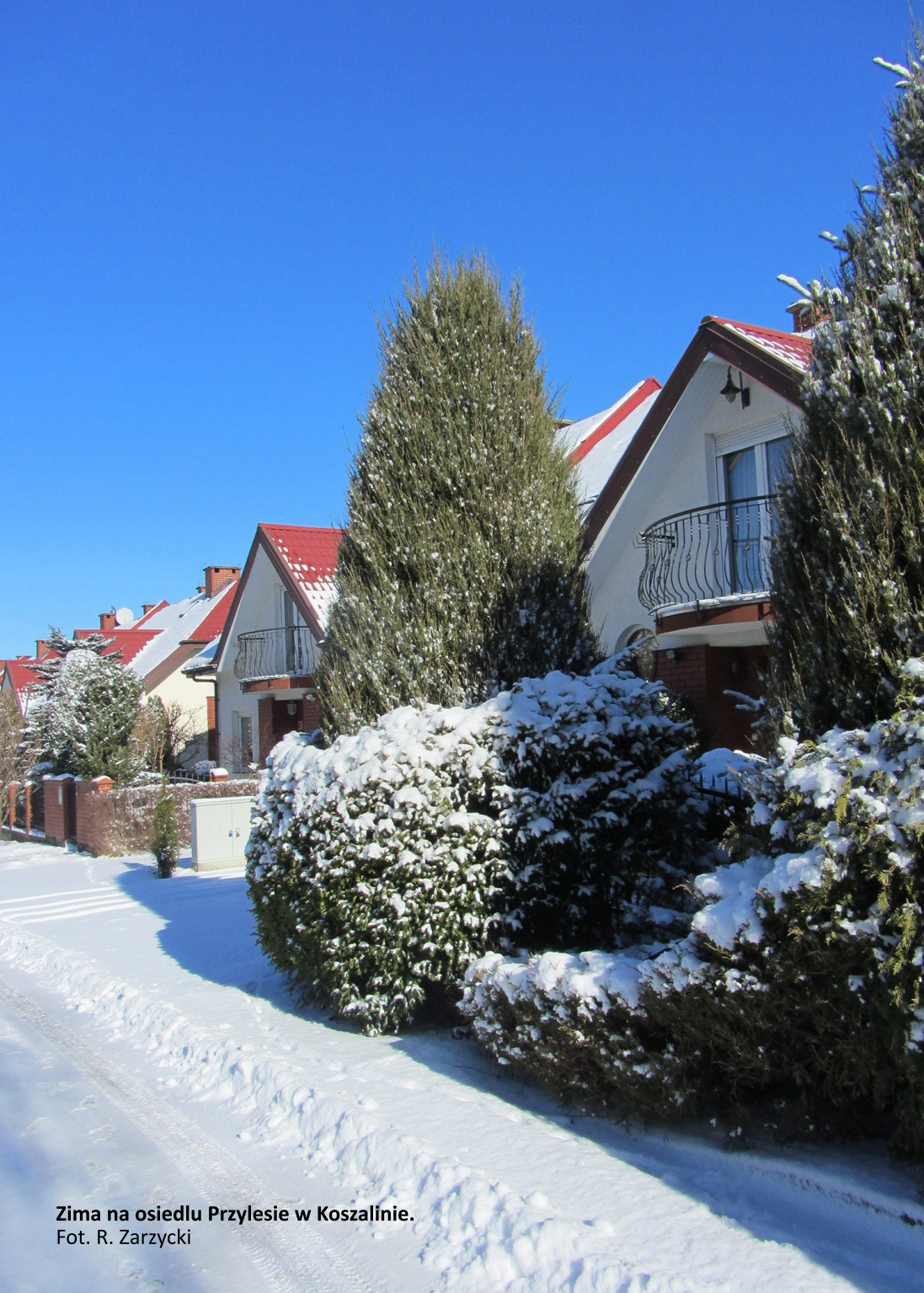
Zima na osiedlu Przylesie w Koszalinie.