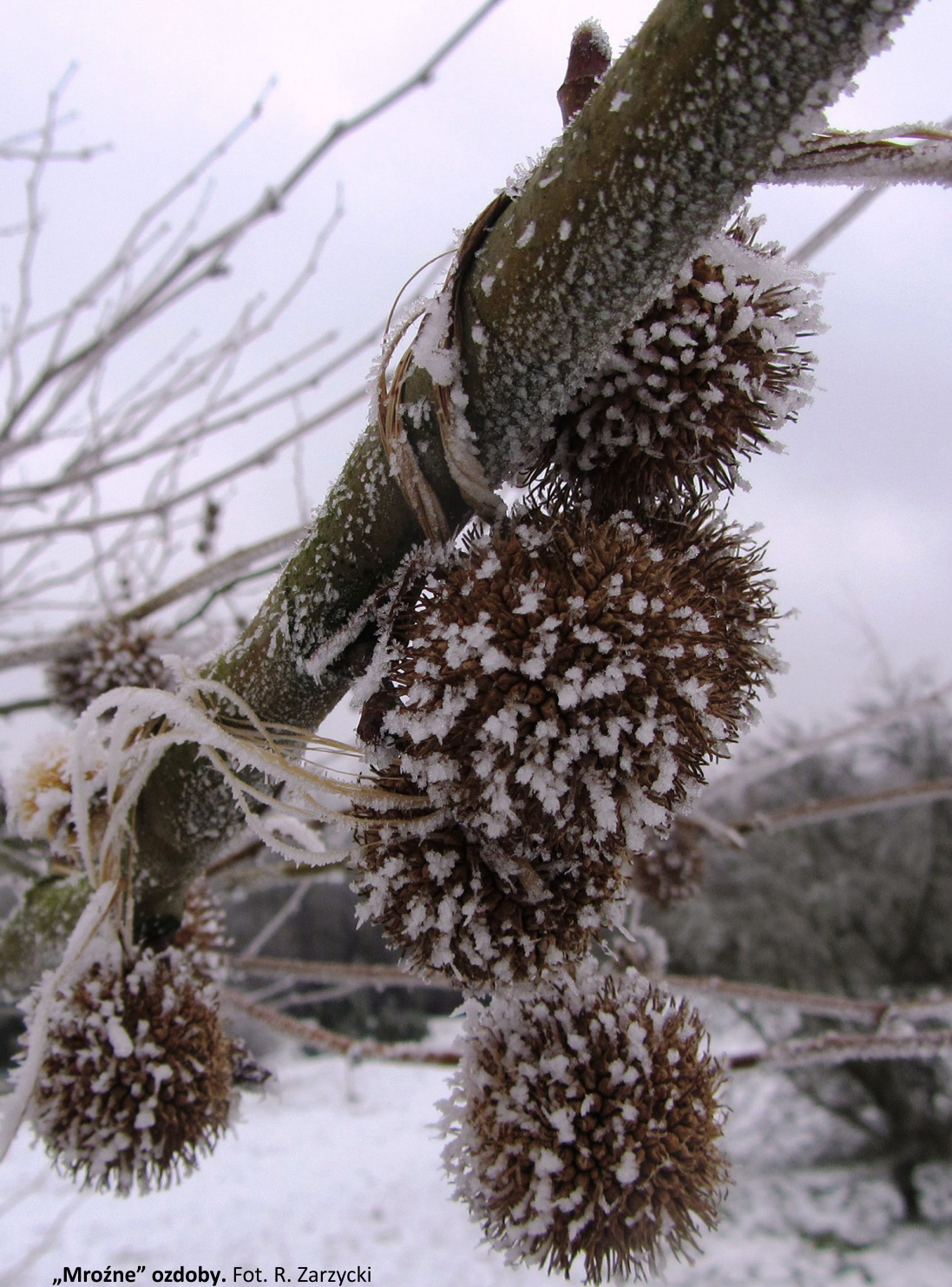
„Mroźne” ozdoby.