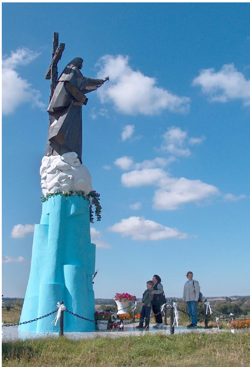
Statua Matki Bożej w Domacynie - dar narodu filipińskiego dla Polski