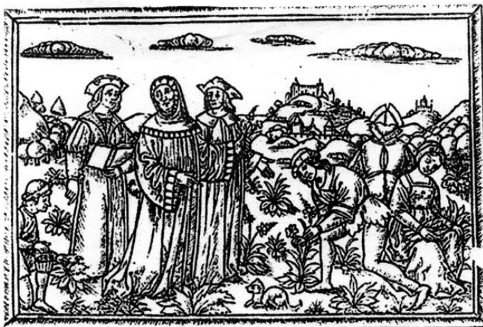
Mistrz z uczniami w ogrodzie botanicznym