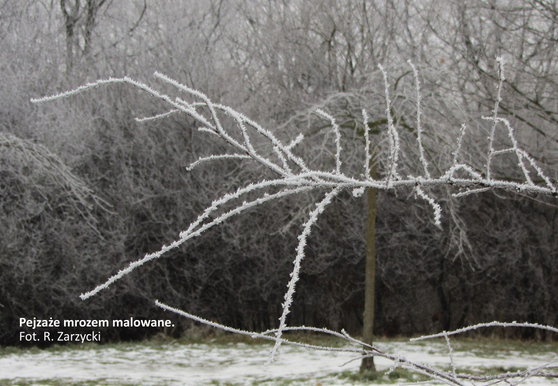
Pejzaże mrozem malowane.