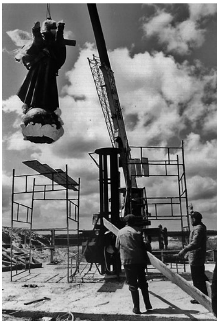
Fragment prac przy ustawianiu figury Matki Boskiej w Domacynie – daru narodu filipińskiego dla Polski Detale figury – jak głowa i ręce były specjalnie osłonięte, by nie zostały uszkodzone w czasie transportu i instalowania figury na wzgórzu.

Wokół statuy Matki Bożej tłum wiernych liczył już ponad cztery tysiące osób. Dochodziła godzina trzynasta, gdy z zaślониętego dotychczas chmura-